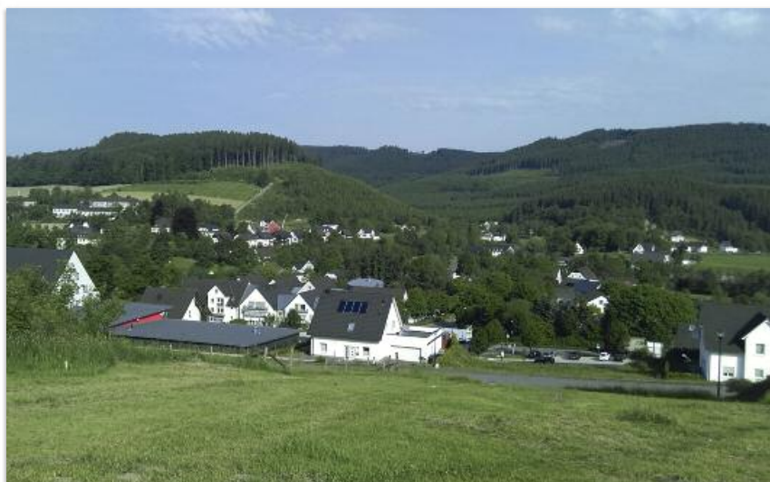
Störmanns Wiese in Eslohe, Blick vom oberen Bereich

Es werden nur minderjährige Kinder, für welche Kindergeld nach dem Bundeskindergeldgesetz bezogen wird, berücksichtigt.