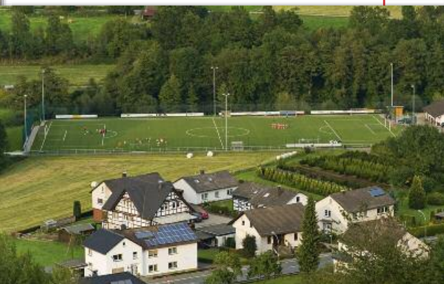
Sportplatz des RW Wenholthausen

Die größeren Vereinsinvestitionen und die Sanierungen der Kunstrasenplätze können aus der den Kommunen jährlich bereitgestellten Investitionspauschale finanziert werden. Der laufende Haushalt, gewissermaßen die Gewinn- und Verlustrechnung der Gemeinde, wird dadurch nicht belastet, könnte durch diese Finanzmittel aber auch keine Entlastung erfahren. Denn die Investitionspauschale ist zwingend für Investitionen zu verwenden.