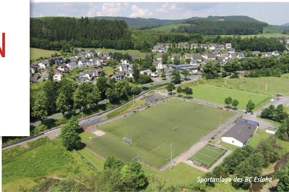
Sportanlage des BC Eslohe